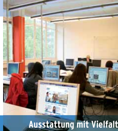
Ausstattung mit Vielfalt

Ausstattung: Betriebssysteme: MS Windows XP PRO, MS Office 2000 PRO, MS Office 2007, diverse Spezial- software. Sprechen Sie uns an!