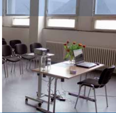
Räume für jeden Anlass